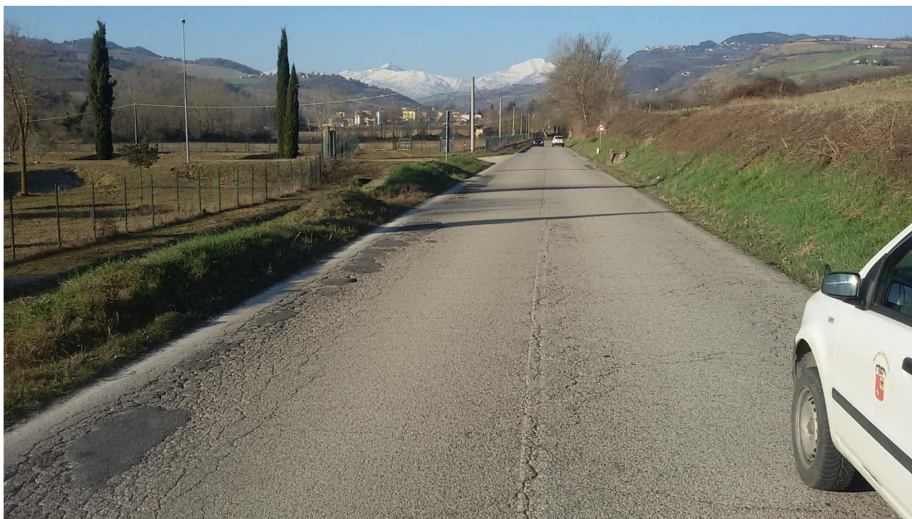
Foto2 - Km 1+000. Avvallamenti del piano viario con fessurazioni longitudinali e trasversali della pavimentazione stradale ed usura dello strato superficiale.