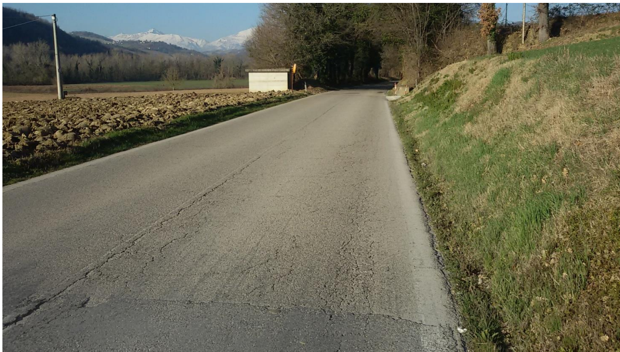
Foto3 - Km 1+500. Avvallamenti del piano viario con fessurazioni longitudinali e trasversali della pavimentazione stradale ed usura dello strato superficiale.